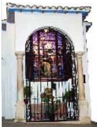
▲ TEMPLETE VIRGEN DE LAS ANGUSTIAS

Pequeños altares situados en casas particulares, con imágenes de vestir de Pasión. Son varios los tabernáculos populares que hay en Carcabuey constituyendo una ruta.