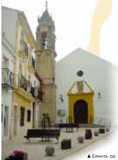
▲ ERMITA DE SAN MARCOS