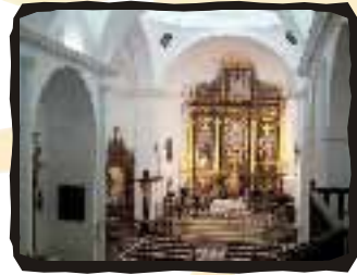
▼ INTERIOR PARROQUIA DE LA ASUNCIÓN

Situada en una privilegiada zona, visible desde la mayor parte de su trazado urbano, dándole seña de identidad. Del siglo XIV, y reformas posteriores en el XVII y XVIII. Se trata de un conjunto arquitectónico de bellas proporciones y elementos de singular belleza. En su interior, acoge muestras de imaginería granadina como el Cristo de Ánimas de Alonso de Mena.