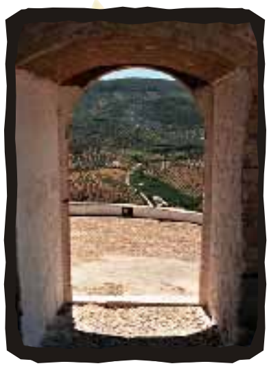
▼ CASTILLO DE CARCABUEY

En el centro de la comarca, aportando la mayor parte de su termino municipal al Parque Natural de las Sierras Subbéticas, nos encontramos Carcabuey, pequeño pueblo olivarero que nos recibe bajo las faldas de sus castillo roquero, inexpugnable bastión y punto defensivo que durante siglos, ha servido para proteger las tradiciones, el tipismo, el sosiego, la calidad de vida.... de un pueblo, que se niega a abandonar sus hondas raíces en pro de la uniformidad y que acoge al visitante con los brazos abiertos; por todo esto, visite Carcabuey y siéntase como en su casa.