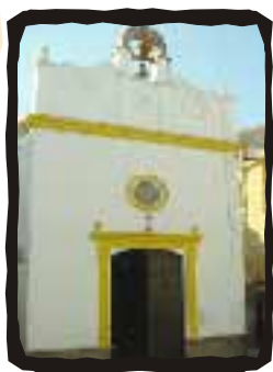
▼ ERMITA DEL CALVARIO