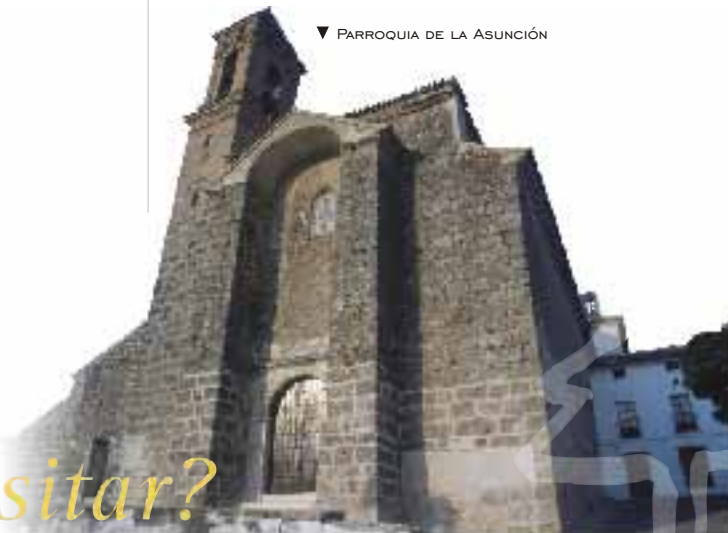
▼ PARROQUIA DE LA ASUNCIÓN

En el centro de la comarca, aportando la mayor parte de su termino municipal al Parque Natural de las Sierras Subbéticas, nos encontramos Carcabuey, pequeño pueblo olivarero que nos recibe bajo las faldas de sus castillo roquero, inexpugnable bastión y punto defensivo que durante siglos, ha servido para proteger las tradiciones, el tipismo, el sosiego, la calidad de vida.... de un pueblo, que se niega a abandonar sus hondas raíces en pro de la uniformidad y que acoge al visitante con los brazos abiertos; por todo esto, visite Carcabuey y siéntase como en su casa.