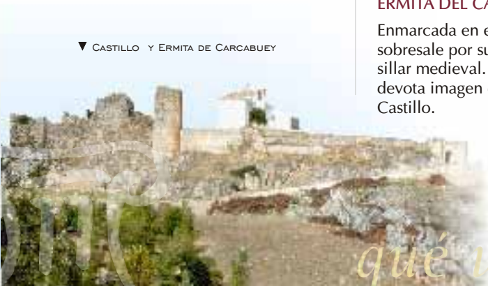
▼ CASTILLO Y ERMITA DE CARCABUEY

Enmarcada en el Castillo de Carcabuey, sobresale por su blanco andaluz sobre el sillar medieval. Acoge en su interior la devota imagen de la Patrona Virgen del Castillo.